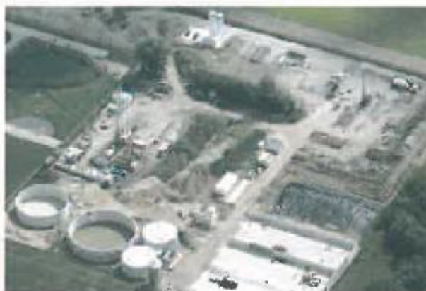
Figure 45 : Emprise au sol d'un site pilote d'injection de CO 2 - Ketzin - Allemagne

L'emprise de la phase finale d'exploration (tests d'injection) est cependant loin d'être négligeable.